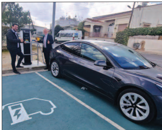
Επίδειξη της χρήσης του φορτιστή

Ο Δήμος Αθηνών συνεχίζει με ενέργειές του την εξυπηρέτηση του κοινού, αλλά και τη μετάβασή του προς την πράσινη ανάπτυξη.