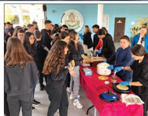
Γονέων για τη βοήθεια και την άρτια οργάνωση, αλλά και όσους ενίσχυσαν οικονομικά τη συγκεκριμένη εκδήλωση.