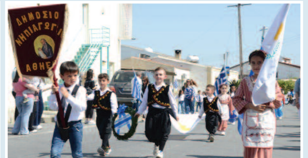
Παρέλαση για την εθνική επέτειο της 1ης Απριλίου