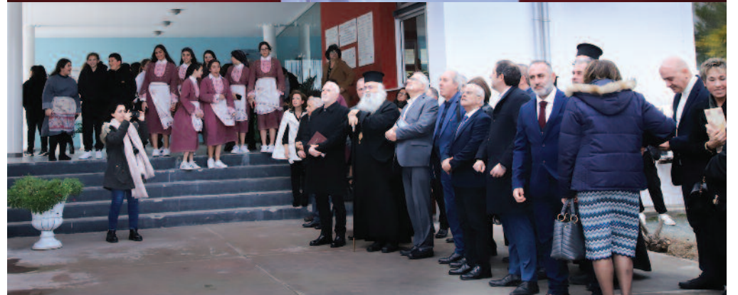
Αποκαλυπτήρια του έργου τέχνης της Αθηνίτικης Δαντέλας

το πιο πάνω έργο. Εντούτοις, λάβαμε επίσημη και γραπτή συγκατάθεση από τον ΚΟΑ, ότι το έργο θα ενταχθεί στους προϋπολογισμούς του για το έτος 2025. Υπάρχουν βάσιμες ελπίδες ότι το έργο θα ξεκινήσει νωρίτερα, αφού ο ίδιος ο ΚΟΑ διαβεβαίωσε ότι είναι σε προτεραιότητα, αν υπάρξει από μέρους του εξοικονόμηση κονδυλίων για το 2024.