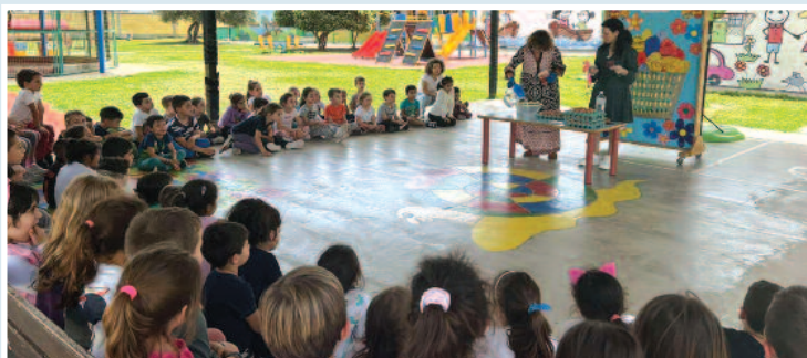
Βάψιμο πασχαλινών κόκκινων αυγών