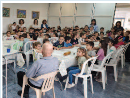
Επίσκεψη στο Κωνσταντινελένιο Κέντρο Ενηλίκων, όπου τραγουδήσαμε πασχαλινά τραγούδια