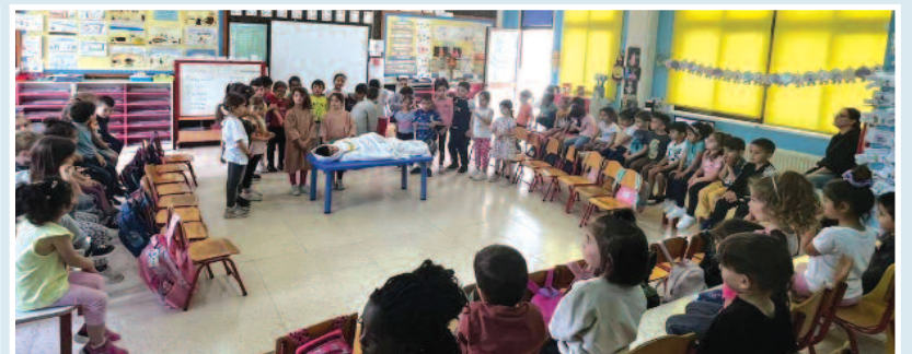
Από τις ενδοσχολικές μας γιορτές για το Πάσχα- Η Ανάσταση του Λαζάρου