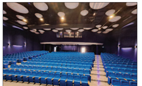
Εσωτερική όψη Αμφιθεατρικής Αίθουσας